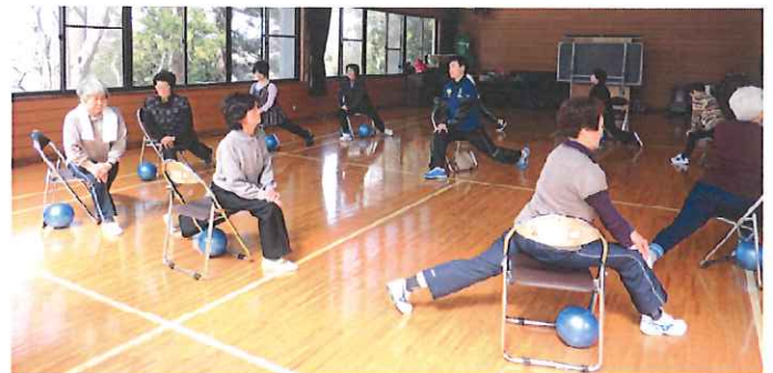
4月10日(水)運動講座の様子です。