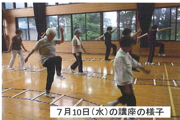
7月10日(水)の講座の様子