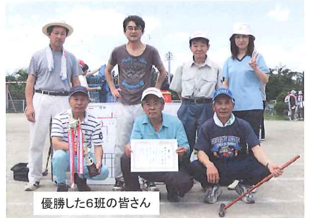
優勝した6班の皆さん