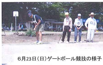
6月23日(日)ゲートボール競技の様子