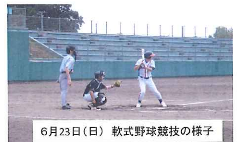
6月23日(日) 軟式野球競技の様子