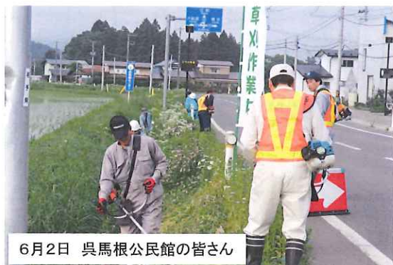
6月2日 呉馬根公民館の皆さん