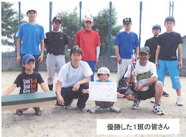
優勝した1班の皆さん