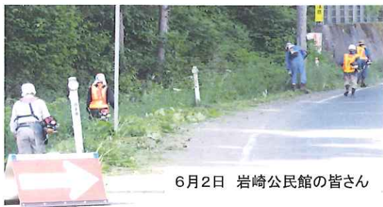
6月2日 岩崎公民館の皆さん