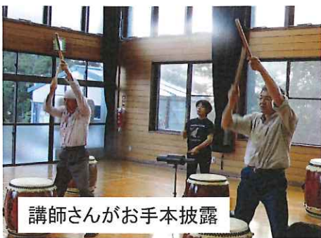
講師さんがお手本披露

今年も10月20日の芸・農・まつり「お楽しみステージ」にて披露する予定ですので、是非ご覧ください。