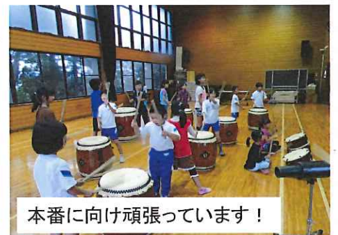
本番に向け頑張っています！