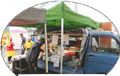
三陸町産直組合さん

出店コーナーには三陸町越喜来(おきらい)から産直組合さんが「さんま」を格安販売したり、地元産いものこ汁、つきたてお餅、PTAバザー、健康チェックコーナーなどたくさんの方で賑わいました。