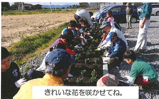
きれいな花を咲かせてね。

今年度のきらめく地域づくり交付金事業は、みんなが広場整備のうち、東屋建設と花壇造りでした。新設の花壇に黒岩小学校児童と一緒に地域の方々が花苗(パンジー・ビオラ)を植えました。