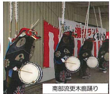
南部流更木鹿踊り