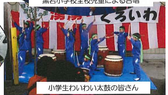
小学生わいわい太鼓の皆さん