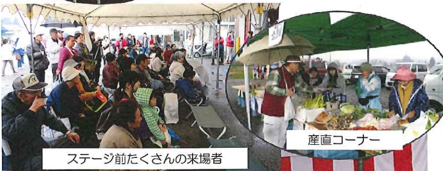
ステージ前たくさんの来場者