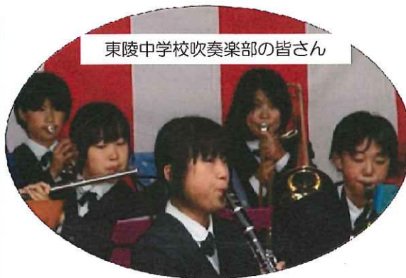
東陵中学校吹奏楽部の皆さん