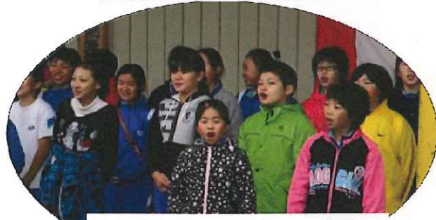
黒岩小学校全校児童による合唱

出店コーナーには三陸町越喜来(おきらい)から産直組合さんが「さんま」を格安販売したり、地元産いものこ汁、つきたてお餅、PTAバザー、健康チェックコーナーなどたくさんの方で賑わいました。