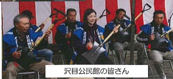
沢目公民館の皆さん

くろいわ産直で販売中 豚肉の名前は 「黒岩豚木(とんた)くん」 に決定したブー!