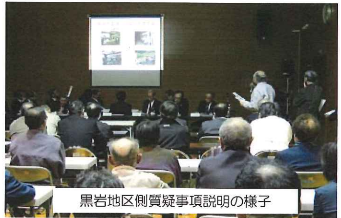
黒岩地区側質疑事項説明の様子

特に環境問題は悪臭問題ということで活発な質問意見が出されました。市側からは生活環境部長がこれまでの経緯や今後の対策を説明され、今後も企業側に指導していくということです。