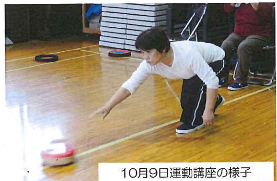
10月9日運動講座の様子