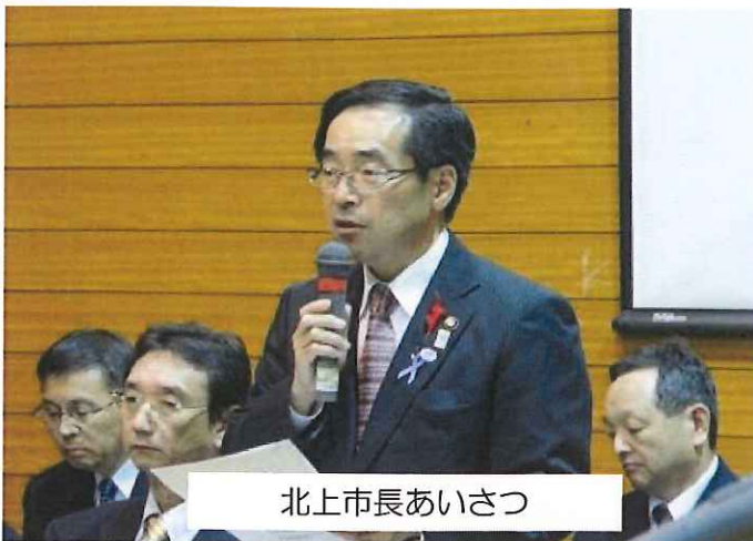
北上市長あいさつ

10月29日(火)に市政座談会が開催されました。今年「堤防建設計画に伴う生活環境の変化」と「環境問題」についての質疑に絞り答弁を求めました。