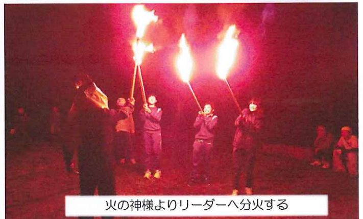
火の神様よりリーダーへ分火する