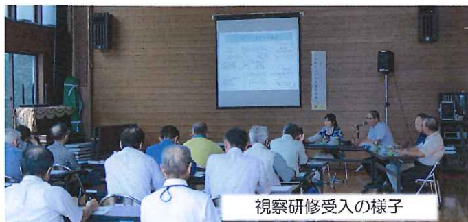
視察研修受入の様子

7月28日(月)一関市大東町の渋民地区自治会等連絡協議会様16名が、視察研修のため来館、主に指定管理者制度などの研修で活発な質問が出されました。