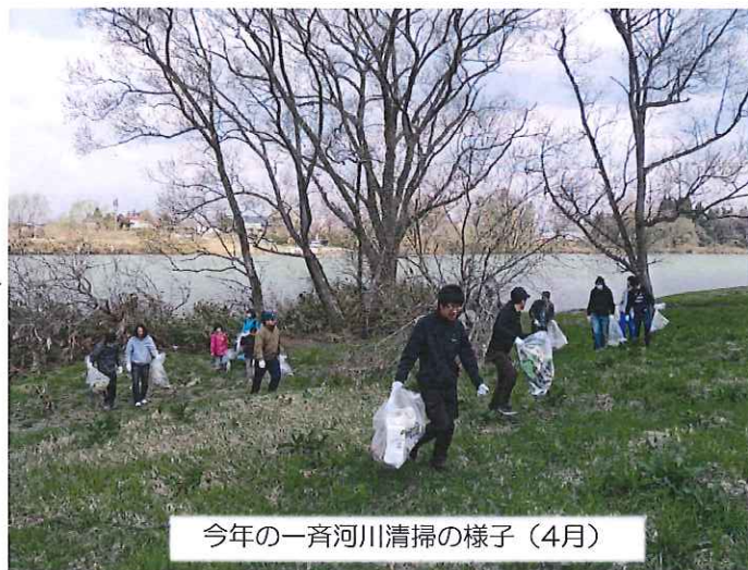
今年の一斉河川清掃の様子(4月)