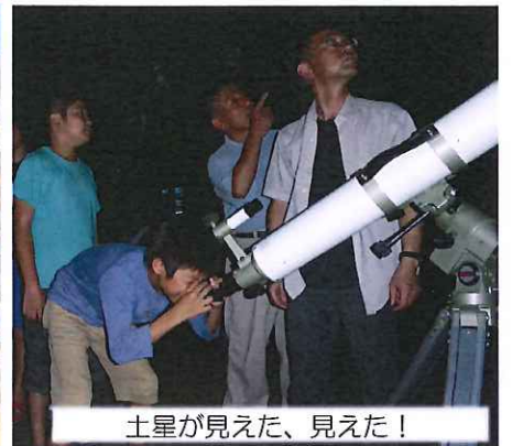
土星が見えた、見えた！