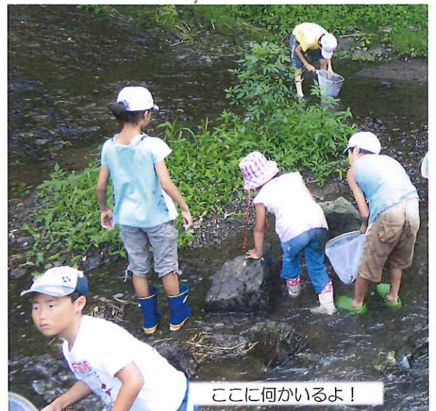
ここに何かいるよ！