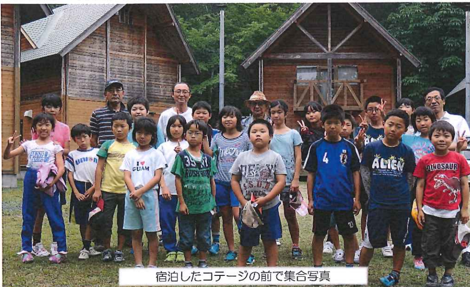
宿泊したコテージの前で集合写真

2日目は、ラジオ体操をしてから、朝食のホットドック作り。これもまたおいしく出来上がり残さず食べました。