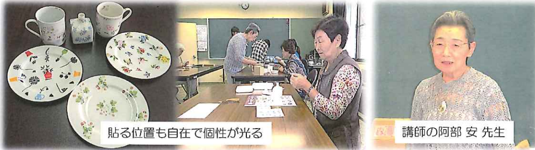
貼る位置も自在で個性が光る

講習は平皿の予定でしたが、先生のご厚意で一輪挿しやマグカップなど色々な器を用意していただきました。これに各々好みの転写紙を貼りつけてオリジナルの器が完成します。作品は先生のもとで焼成されたのち参加者へ渡されます。