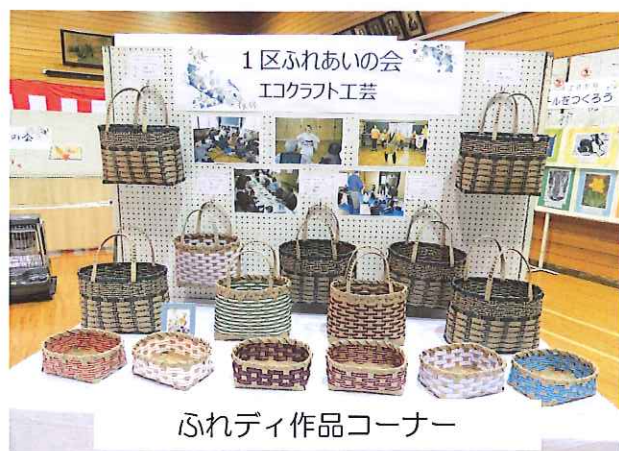
ふれディ作品コーナー