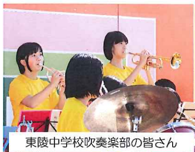
東陵中学校吹奏楽部の皆さん

出店コーナーには黒沢尻工業高校の生徒さんが製作したパーベキューコンロを販売しました。好評につき即完売となりました。売り上げは全て震災復興に寄付されるそうです。