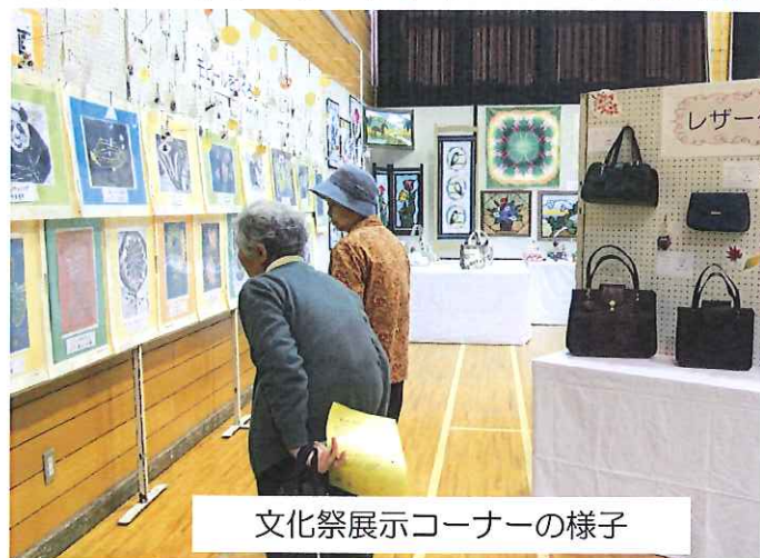
文化祭展示コーナーの様子

軽食コーナー(和室)には事業の風景写真や最終日には健康チェックコーナーを設けて血压・血流チャックなどできてとてもにぎわっていました。