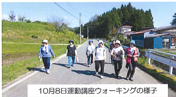
10月8日運動講座ウォーキングの様子