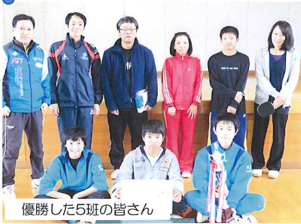
優勝した5班の皆さん