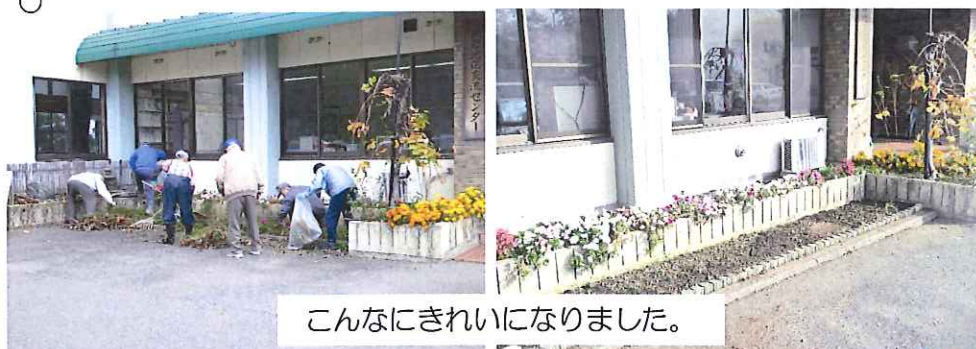
こんなにきれいになりました。

会員の皆さんで作った芋のこ汁を並べて、ゲームや歌など楽しい芋煮会がスタートしました。