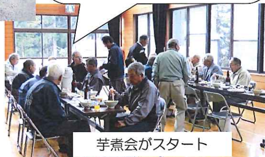
芋煮会がスタート

交流センター周辺の除草作業、枯葉集めなど、とてもきれいにしていただきました。ありがとうございました。