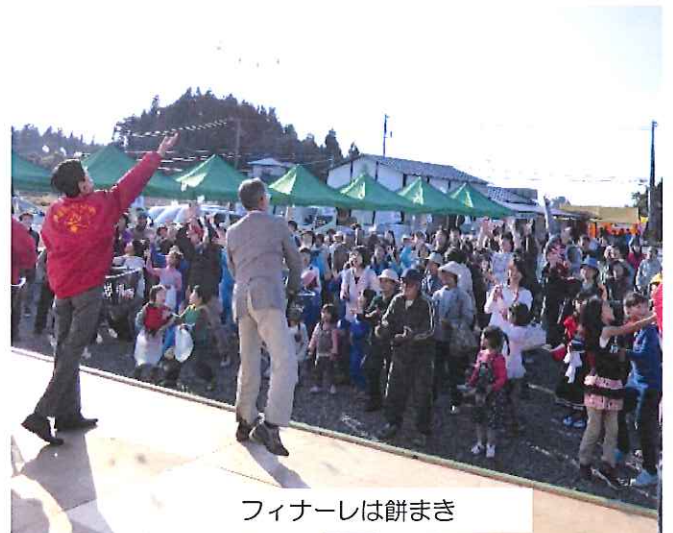
フィナーレは餅まき

今年も(株)ケー・アイ・ケー様の多くのボランティアスタッフの協力のおかげでまつりを運営することができました。ありがとうございました。