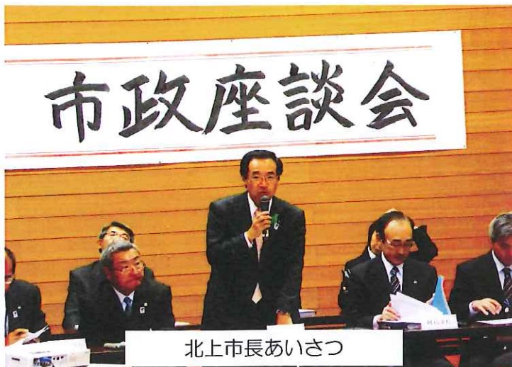
北上市長あいさつ

10月30日(木)に市政座談会が開催されました。今年「県内住みやすい街5年連続1位の取組と展開」についての政策をお聞きしました。