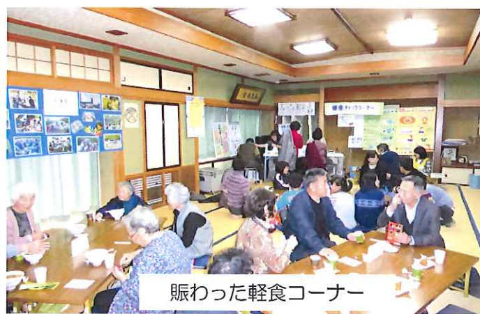
賑わった軽食コーナー