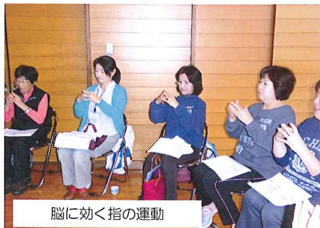
脳に効く指の運動

日常の生活でも常に「新しいこと」「難しいこと」「できないこと」に積極的に挑戦し、脳が活性化されるよう心掛けましょう。