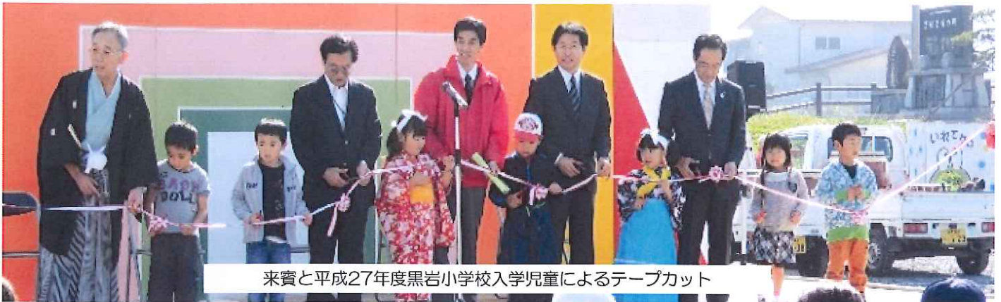
来賓と平成27年度黒岩小学校入学児童によるテープカット

10月19日(日)快晴の中、第16回湧湧ランドくろいわ芸・農・まつりが黒岩まんなか広場で開催されました。毎年恒例の来年度黒岩小学校入学児童8名と来賓によるテープカットでまつりのスタートとなりました。ステージ公演では、岩崎長根神楽でまつりの成功を祈願し、近隣3地区より「立花八士踊」、「行山流口内鹿踊」「更木石名畑神楽」、東陵中学校吹奏楽部の皆さんなど地区外からもたくさんの方にまつりを盛り上げていただきました。