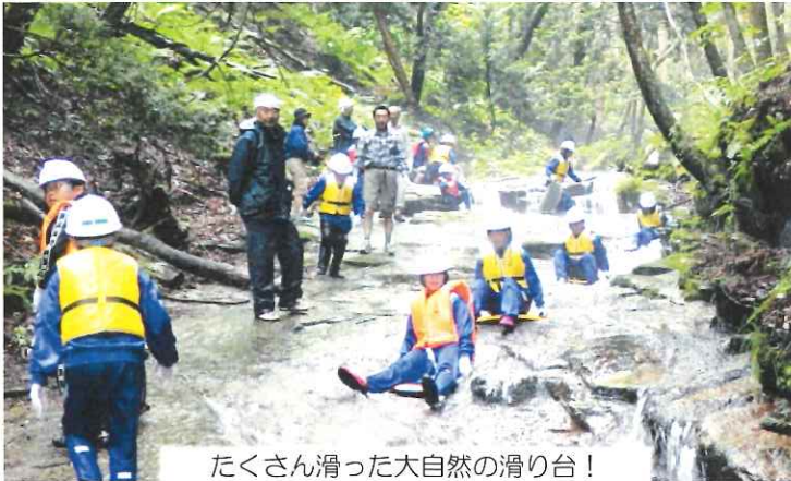
たくさん滑った大自然の滑り台！

1日目の大沢探検での沢登りでは大きな岩間を流れるきれいな川の水の冷たさに、最初は慎重に登っていた子供達でしたが、だんだんと慣れていくにつれ滝に打たれたりボードを使用しての沢滑りを楽しんだり、大自然と触れ合うことが出来ました。