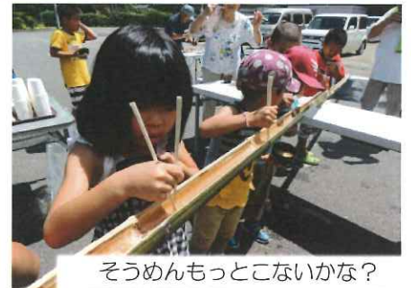
そうめんもつとこないかな？