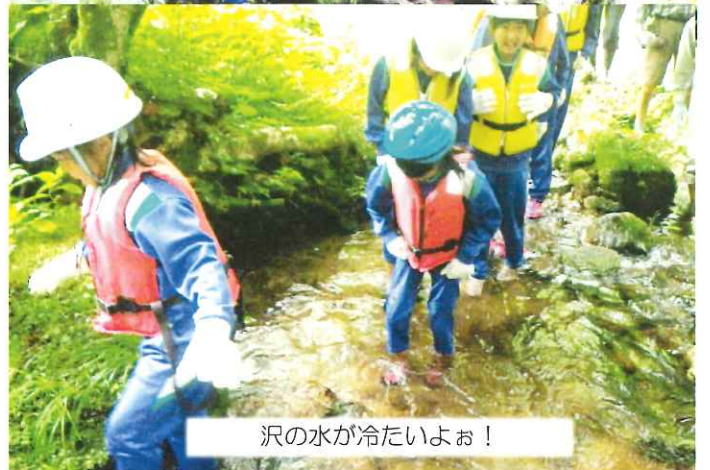
沢の水が冷たいよお！