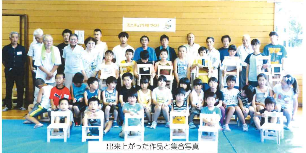
出来上がった作品と集合写真

お昼はみんなで「流しそうめん」で、楽しみました。とても暑い1日でしたが、参加された皆さんありがとうございました。