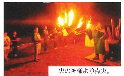
火の神様より点火。