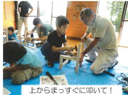
上からまっすぐに叩いて！