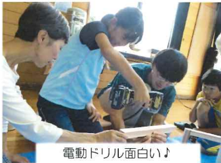
電動ドリル面白い♪