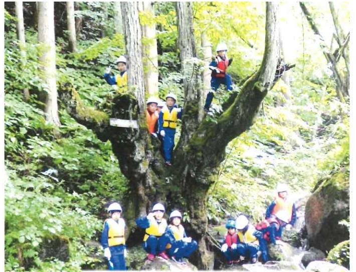
ゴール地点での集合写真

夕食のバーベキューでは女子が炭をおこし、男子が焼きそば作りにチャレンジし、どちらも上手にできました。キャンプファイヤーでは5年生が司会を行い、6年生5名が「責任」「友情」「健康」「協力」「規律」の5つの誓いを約束し火の神様より火を受け取りました。他にも歌やダンスをしたり、夢を発表したり、わいわい塾生の成長を感じるキャンプファイヤーとなりました。