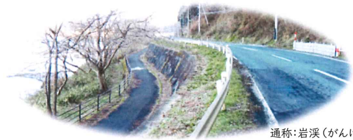
通称：岩溪（がんけい）