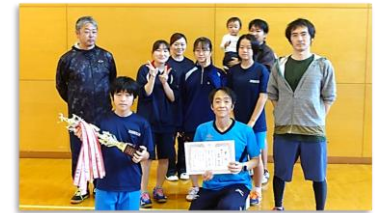
<優勝した5班の皆さん>