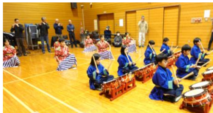
－息を合わせた太鼓の演奏－

黒岩地区の郷土芸能である「めでた舞」の寒げいこを1月5日から11日までの1週間、交流センターで行いました。来年度の活動へ向けて、黒岩地区東桜小3・4・5年生13名が参加し、基本の舞と太鼓の演奏を学びました。