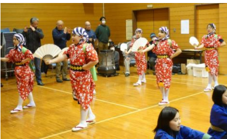
－指先まで意識した踊り－