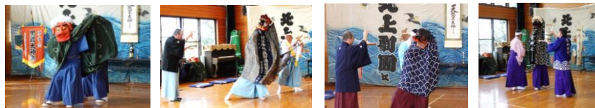
－第5回黒岩地区芸能伝承会の様子－