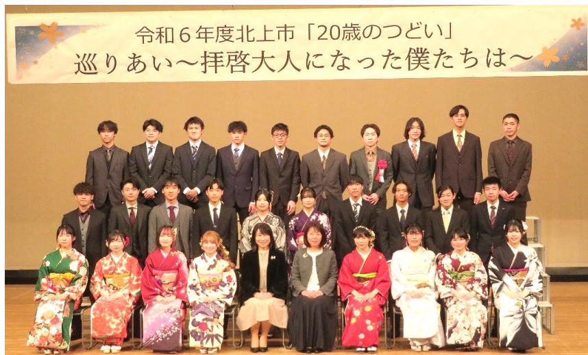
令和6年度北上市「20歳のつどい」 巡りあい～拝啓大人になった僕たちは～

1月12日(日)、令和6年度北上市「20歳のつどい」がさくらホールfeat. ツガワで開催されました。市内の出席予定者は723名、うち黒岩地区の対象者6名で当日参加された方は、4名でした。華やかな振袖姿や、りりしいスーツ姿で、友人との再会に喜び合っていました。20歳を迎えられた皆さま、ご家族の皆さま、おめでとうございます。